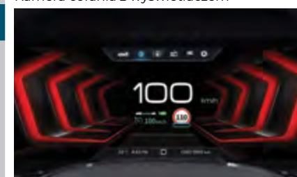
10,25" cyfrowy zestaw wskaźników