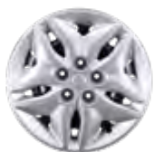
16" Felgi stalowe