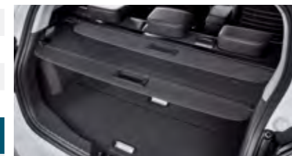
Roleta i podwójna podłoga bagażnika