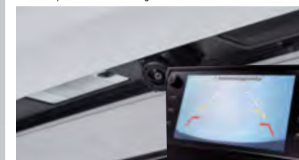
Kamera cofania z wyświetlaczem