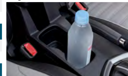
Konsola centralna z uchwytem na kubki