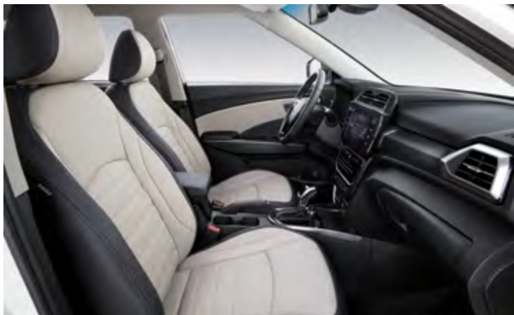
TAPICERKA DWUKOLOROWA SZARO-CZARNA (EBG)