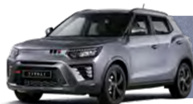
IRON METAL (ADE) METALIZOWANY