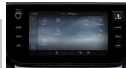
9" wyświetlacz z systemem nawigacji