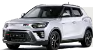
GRAND WHITE (WAA) NIEMETALIZOWANY