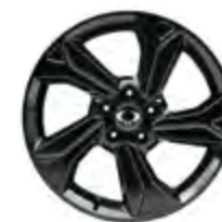
18" Felgi aluminiowe "diamentowe" w kolorze czarnym