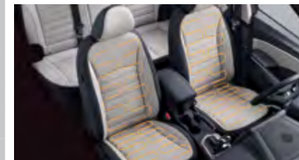
Fotele przednie podgrzewane