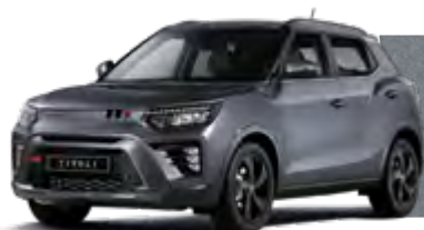
PLATINUM GREY (ADA) METALIZOWANY