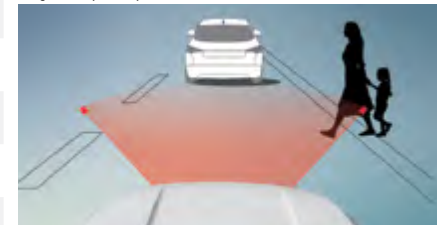
System ostrzegania i samoczynnego hamowania w przypadku ryzyka kolizji (AEB)