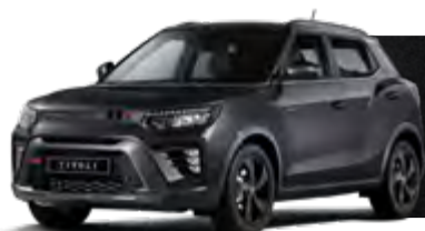
SPACE BLACK (LAK) METALIZOWANY