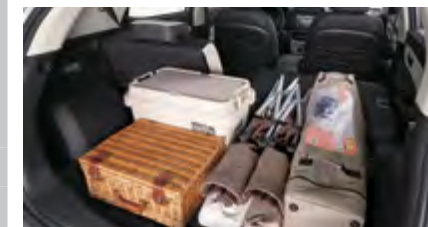
Tylna kanapa składana i dzielona 60 : 40