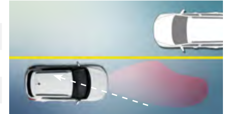
Automatyczna zmiana świateł: drogowe / mijania (HBA)