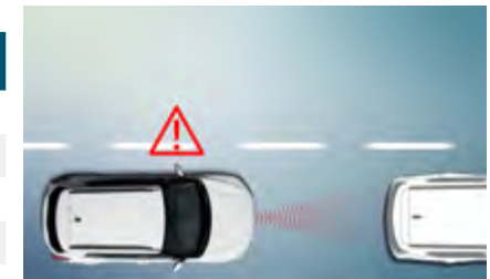
Alert o niebezpiecznej odległości od poprzedzającego pojazdu (SDW)