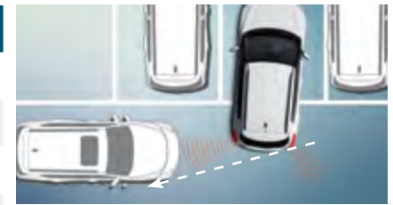
Ostrzeżenie o ruchu poprzecznym z tyłu pojazdu (RCTW)