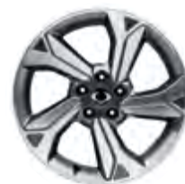
18" Felgi aluminiowe "diamentowe"