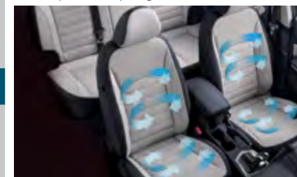
Fotele przednie wentylowane