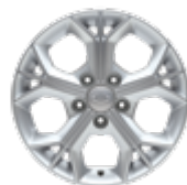
16" Felgi aluminiowe