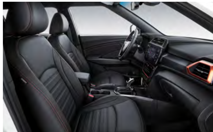
TAPICERKA W KOLORZE CZARNYM Z PRZESZYCIAMI W KOLORZE POMARAŃCZOWYM W PAKIECIE LUXURY (LCG)