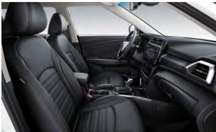
TAPICERKA W KOLORZE CZARNYM (LBH)