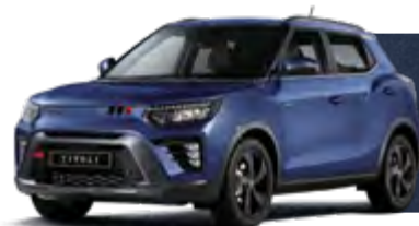
DANDY BLUE (BAS) METALIZOWANY