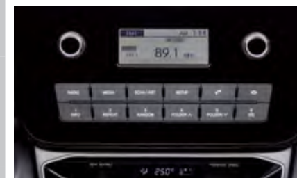
Radio 2DIN z MP3