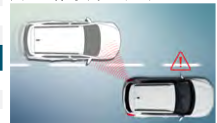
Ostrzeżenie o niezamierzonej zmianie pasa ruchu i kolizji (LCW)