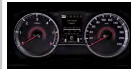
Standardowy zestaw wskaźników