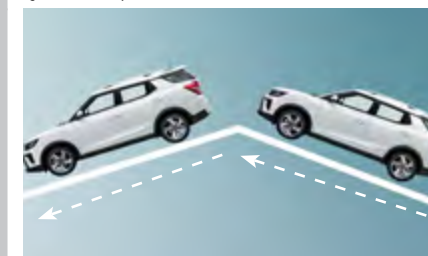
HDC i HSA